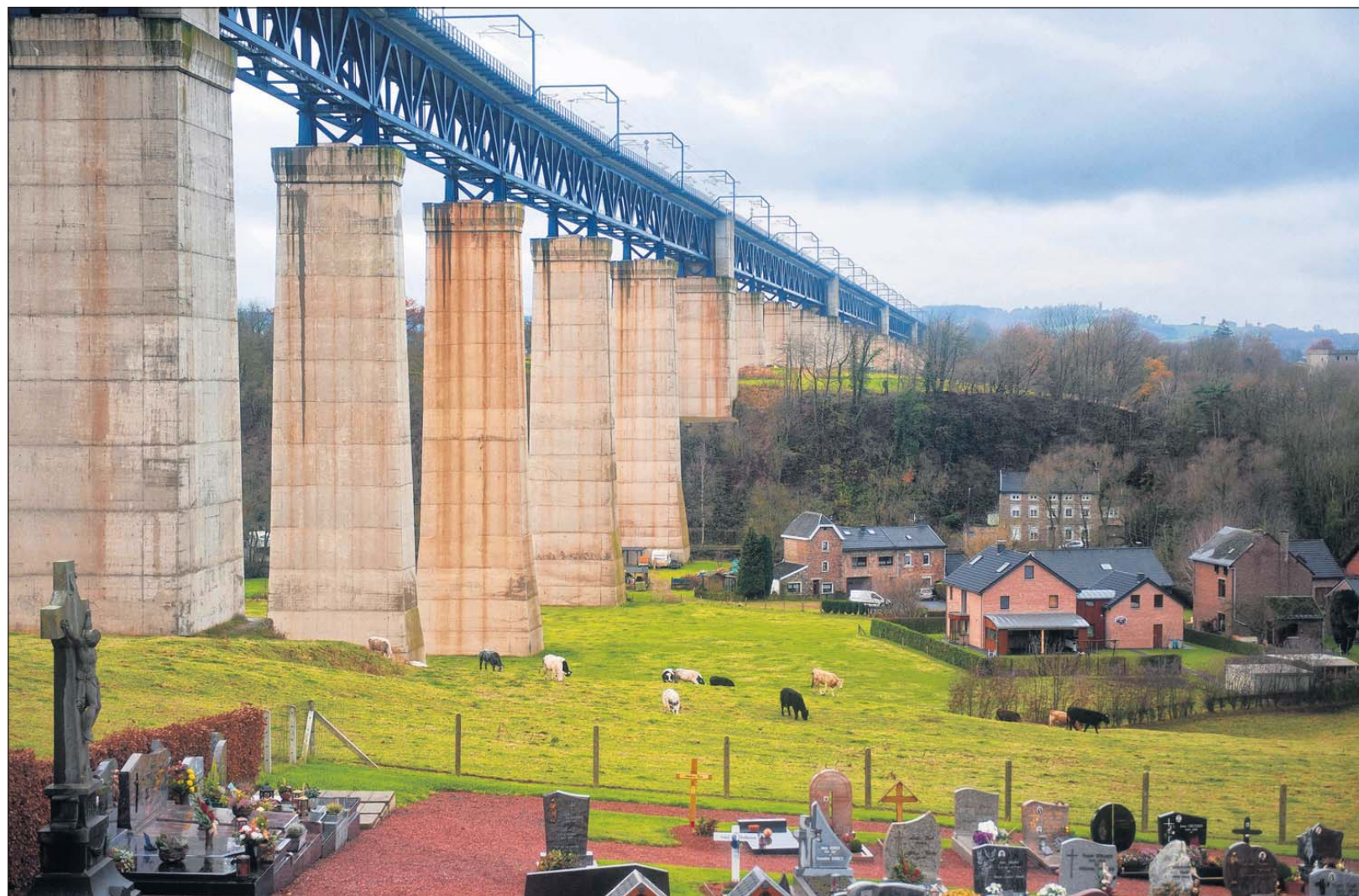
De gemeente Moresnet werd door de nieuwe grenzen in 1816 opgedeeld. Dit deel van het dorp viel net buiten het neutrale staatje.